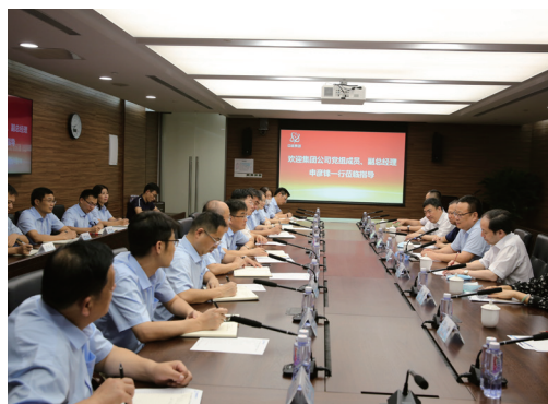
8月4日,中核集团党组成员、副