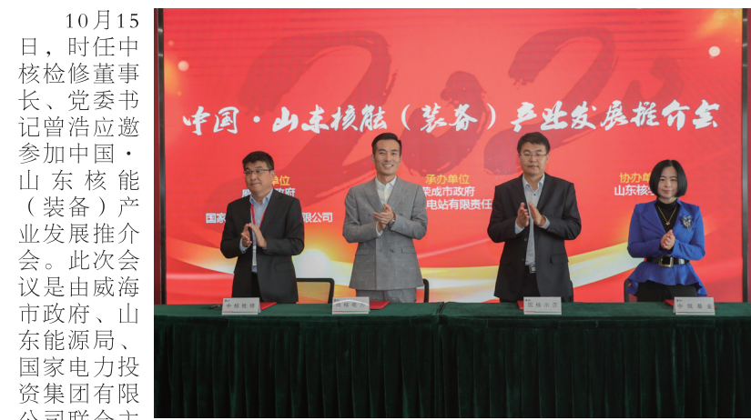
10月15日，时任中核检修董事长、党委书记曾浩应邀参加中国·山东核能（装备）产业发展推介会。此次会议是由威海市政府、山东能源局、国家电力投资集团有限公司联合主办的一次大型核电产业发展交流会。国家电力投资集团有限公司董事长、党组书记钱智民，国家能源局中国核电发展研究中心副主任栾健，山东省能源局党组书记、局长栾健，山东省威海市市委副书记、市长同剑波，市委常委、常务副市长王亮，中国核工业建设股份有限公司副总经理杨振华等领导参会。

会上，中核检修有限公司与国核示范电站有限责任公司签署了国核示范堆CAP1400检修领域合作意向书。此次合作意向书的签订标志着中核检修有限公司与国家电力投资集团有限公司继山东海阳AP1000之后再次展开合作。